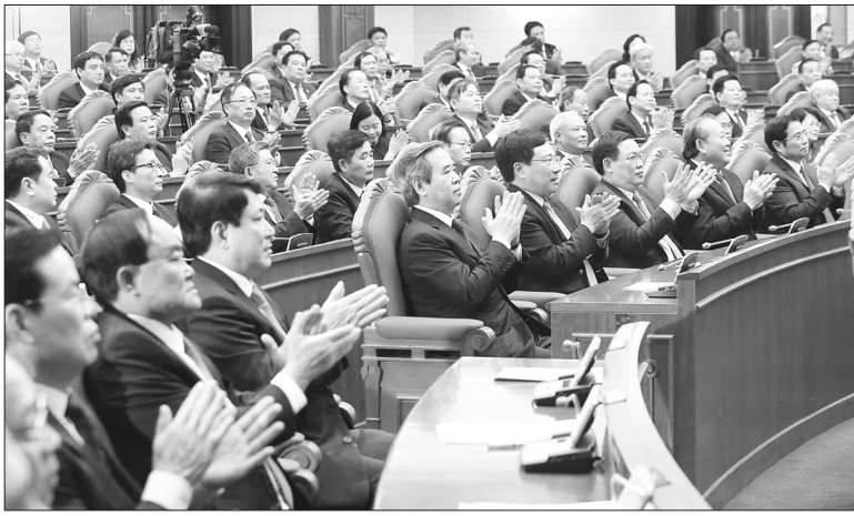
Hội nghị lần thứ 12 Ban Chấp hành Trung ương Đảng khóa XII thành công tốt đẹp

Ủy viên Ban Chấp hành Trung ương phải có phẩm chất đạo đức và lối sống trong sáng, gương mẫu, được cán bộ, đảng viên và nhân dân tín nhiệm; có tinh thần trách nhiệm cao, tận tụy với công việc; dám hy sinh lợi ích cá nhân vì lợi ích chung của Đảng, của đất nước. Gương mẫu chấp hành sự phân công và nguyên tắc tổ chức, kỷ luật của Đảng, nhất là nguyên tắc tập