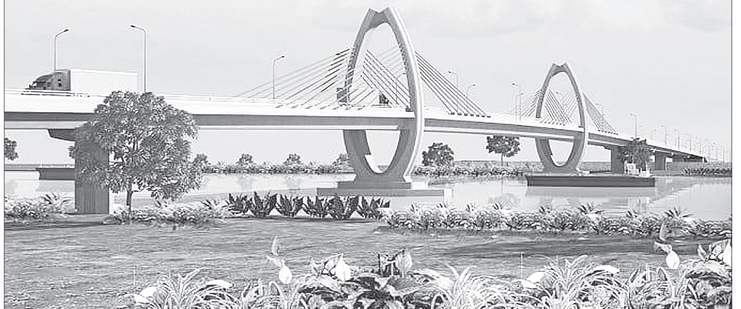
Phối cảnh cầu Quang Thanh nối huyện Thanh Hà với huyện An Lão (TP Hải Phòng)