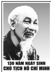
130 NĂM NGÀY SINH CHỦ TỊCH HỒ CHÍ MINH