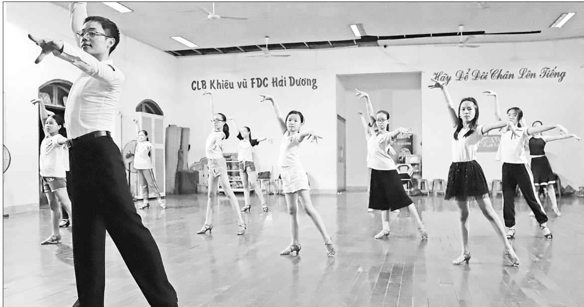
Các thành viên Câu lạc bộ Khiêu vũ FDC Hải Dương đã trở lại luyện tập sau gần 4 tháng nghỉ do dịch Covid-19

Các em nhỏ vui mừng vì được trở lại gặp thầy, gặp bạn và thỏa sức thể hiện đam mê với trái bóng. Cha mẹ các em cũng tỏ ra vui mừng không kém. Một phụ huynh có con theo học tại CLB này cho biết bản thân anh cũng đỡ áp lực, lo lắng. Suốt thời gian học sinh phải nghỉ học vì dịch Covid-19, do vợ chồng anh bận đi làm nên con nhỏ phải ở nhà một mình, khóa trái cửa. "Cháu ít được tiếp xúc với bạn bè, lại ở nhà như kiểu giam lỏng nên trầm tính, ít nói hẳn. Nếu tình trạng ấy kéo dài nữa tôi còn lo cháu có nguy cơ bị trầm cảm. Từ hôm được đi học trở lại, kết hợp tham gia CLB thể thao khiến cháu vui mừng ra mặt. Vợ chồng tôi cũng không còn lo lắng như trước", phụ huynh này nói.