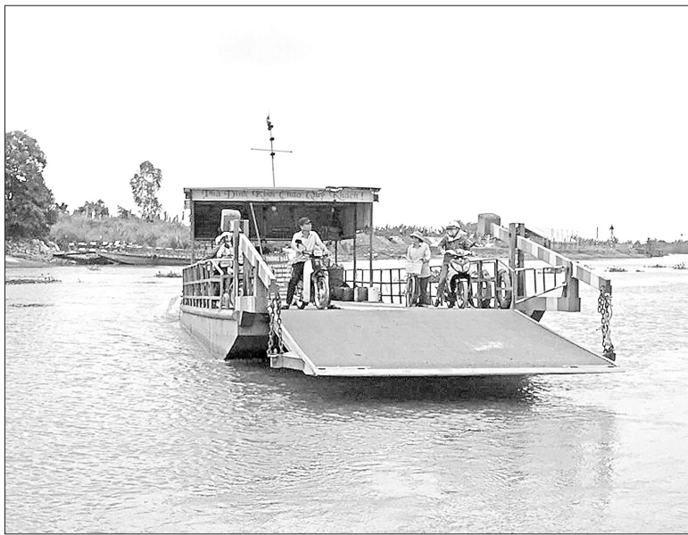
Cầu Đình được xây dựng sẽ thay thế đò Đình, giúp người dân đi lại an toàn, thuận tiện hơn, nhất là trong mùa mưa lũ

Theo đánh giá của UBND TP Hải Phòng, việc đầu tư xây dựng cầu Đình là cần thiết nhằm kết nối các quốc lộ 10, 37,