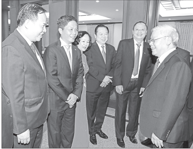
Tổng Bí thư, Chủ tịch nước Nguyễn Phú Trọng và các đại biểu dự phiên bế mạc Hội nghị