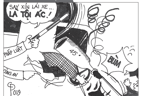
Tranh: CHU ĐỨC TIẾN